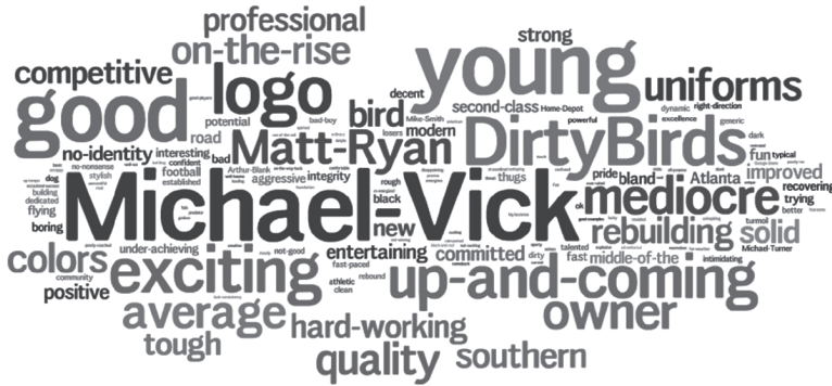
شكل ٨-١: تصوّرات جماهير فالكونز على المستوى الوطني (٢٠٠٩).

محلّيًا، كان لهذا تأثير، وقد أثبتت أبحاث الجماهير ذلك. يبيّن الشكل ٨-١ سحابة الكلمات التي تصوّر سمعة الفريق على المستوى الوطني. ويشير حجم الكلمة إلى العدد النسبي لمرات ذكرها عندما يُطلب من المستهلكين وَصْف العلامة التجارية فالكونز. على الصعيد الوطني، سترى أن Michael Vick (مايكل فيك) كان لا يزال مرتبطًا ارتباطًا وثيقًا بالفريق، مع حلول رقصة Dirty Birds (ديرتي بيرد) في المرتبة الثانية. والآن قارن ذلك مع الشكل ٨-٢، وهو سحابة كلمات لتصوّرات الجماهير بشأن العلامة التجارية في سوق أتلانطا خلال عام واحد من انطلاق حملة «انهض» (٢٠٠٩). تتضمن الكلمات الكبيرة في سحابة كلمات أتلانطا كلمات مثل: team (بمعنى فريق)، وcommitment (بمعنى التزام)، وexciting (بمعنى إثارة)، وcommunity (بمعنى مجتمع)، بالإضافة إلى مالك الفريق الشهير Arthur Blank (آرثر بلانك).