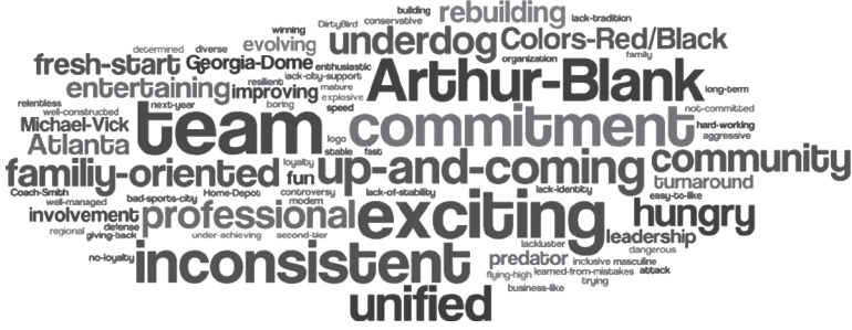
شكل ٨-٢: تصوّرات جماهير فالكونز على مستوى أتلانتا (٢٠٠٩).

القدم المفضّلة في أمريكا، وتحوّلت نسبة خمسة بالمائة إضافية من الجماهير «العاديين» إلى جماهير «متحمّسين». لم يتحقّق ذلك بين عشية وضحاها؛ فعندما تمرّ العلامات التجارية بأزمة في علاقتها مع المستهلكين، فإن إعادة بناء تلك العلاقة تستغرق وقتًا أطول بكثيرٍ من هدمها، إلا أن فريق التسويق شهد تحسُّناً؛ كان الزخم موجوداً، وجاءت مساعدة إضافية لذلك عن طريق اتفاقية بين فالكونز ومدينة أتلانتا لبناء استاد فالكونز الجديد. سيصبح سميث وفريقه الآن قادرين على التأثير في تجربة الجمهور تأثيراً مباشراً من خلال إسهاماتهم في تصميم الاستاد الجديد وسماته.